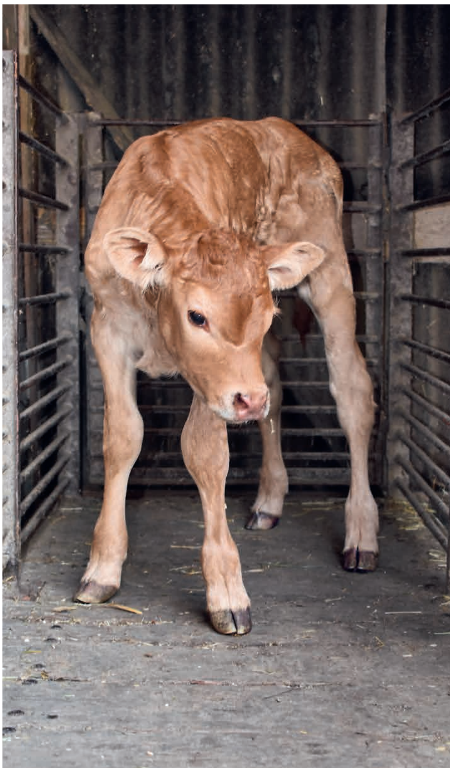
Le poids du veau qui vient de naître s'inscrit sur la balance pour veaux.

Je profite de l'occasion pour vous présenter plus en détail, chères lectrices et chers lecteurs, notre expérience pratique en la matière. Dans notre exploitation, la balance pour veaux est installée juste à côté du box de vêlage. Peu après leur naissance, les veaux y sont pesés afin de déterminer leur poids de naissance. Nous en profitons également pour leur mettre leurs marques auriculaires et leur administrer du sélénium par voie intramusculaire et le médicament polyvalent homéopathique Calcium carbonicum Hahn. par voie orale. Il faut ensuite répertorier le poids à la naissance, la date de naissance, le sexe, le déroulement du vêlage et le numéro BDTA ad hoc. Cette liste sert par la suite à annoncer la naissance sur Agate.